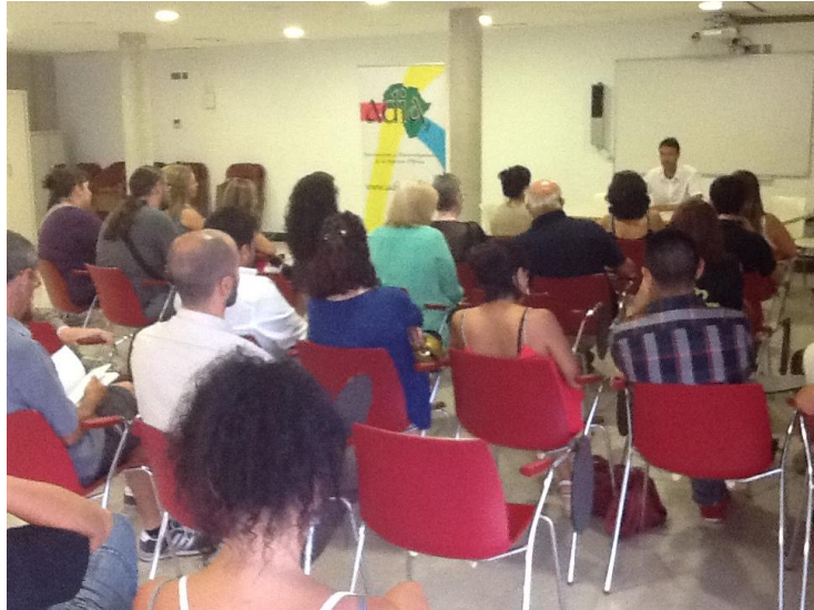
Presentació del llibre El color del hilo a la seu del CEM La Mar Bella

La col·lecció Edicions Solidàries té com objectiu publicar treballs de caràcter solidari, humà i amb un clar contingut en valors i els seus autors cedeixen de forma altruista tots els drets. Edicions Solidàries col·labora en la difusió de l'acció solidària, cerca consolidar la seva activitat amb el patrimoni cultural i es proposa aconseguir recursos econòmics de suport a la tasca desenvolupada per ADIA.