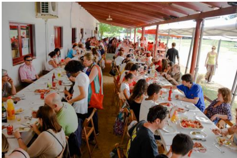
Arròs solidari 2015

El dia 10 de maig de 2015 es va celebrar a l' Escola Bressol Gespa de la UAB el XIVè Arròs Solidari . L'acte, organitzat per l'AdiaGrupCerdanyola, va ser un èxit que va aplegar unes 175 persones. Els fons recaptats es van destinar als projectes d'ADIA.