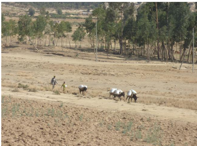
Imatge de la Regió del Tigray

Les poblacions on treballem són: Wukro, Agulae i Negash a la woreda de Kelte-Awlaelo (1.010,28 km 2 i 116.014 habitants) i Alitena a la woreda d'Irob (1.532,64 km 2 i 25.471 habitants). A Wukro hi viuen unes 42.000 persones (any 2014), la població està situada a 1.972 metres sobre el nivell del mar i a uns 40 km de la ciutat de Mekele, capital de la Regió del Tigray. Segons dades de l'últim cens, facilitades per l'Agència Central d'Estadística d'Etiòpia, Agulae té una població de 4.808 habitants i es troba a 11 quilòmetres al sud de Wukro, mentre que Negash amb una població de 7.753 persones s'ubica 15 quilòmetres al nord. Alitena és una petita població d'uns 4.905 habitants situada més al nord, a només 7 quilòmetres de la frontera amb Eritrea.