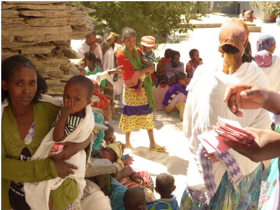
Programa suplement nutricional: organitzant la distribució del suplement a Alitena

S'ha pogut comprovar com les mares que han rebut la capacitatció apliquen els coneixements adquirits a la seva vida diària, millorant la qualitat de vida de la unitat familiar i actuant com a agents transmissors de la formació rebuda cap a la resta de la comunitat.