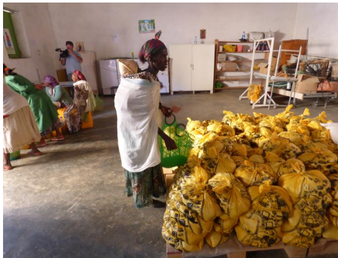
Programa suplemento nutricional: distribución en Alitena

Durante el año 2015 el programa proporcionó suplemento nutritivo y atención médica a 1.800 niños y niñas con desnutrición moderada de las woredas de Irob y Kelte-Awlaelo; el programa se complementa con la capacitación en salud, higiene y planificación familiar que se dirige a las madres con el fin de mejorar las condiciones de vida y de salud del hogar y por extensión de la comunidad.