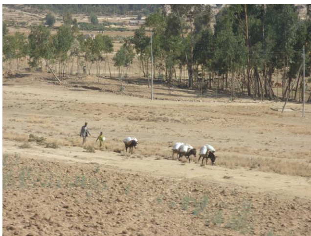
Imagen de la Región del Tigray

Las poblaciones donde trabajamos son: Wukro, Agulae y Negash en la woreda de Kelte-Awlaelo (1.010,28 km 2 y 116.014 habitantes) y Alitena en la woreda de Irob (1.532,64 km 2 y 25.471 habitantes). En Wukro viven unas 42.000 personas (año 2014), la población está situada a 1.972 metros sobre el nivel del mar y a unos 40 km de la ciudad de Mekele, capital de la Región del Tigray. Según datos del último censo, facilitados por la Agencia Central de Estadística de Etiopía, Agulae tiene una población de 4.808 habitantes y se encuentra a 11 kilómetros al sur de Wukro, mientras que Negash con una población de 7.753 personas se ubica 15 kilómetros al norte. Alitena es una pequeña población de unos 4.905 habitantes situada más al norte, a sólo 7 kilómetros de la frontera con Eritrea.