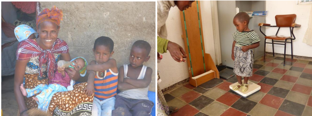
Programa suplemento nutricional: madre suministrando el suplemento a su hijo en Wukro y control de peso y estatura en Alitena

La distribución del suplemento alimenticio se hace semanalmente en el centro de salud donde se prepara la llamada ración seca de cada niña/o (cada dos semanas en el caso de Agulae y Negash). La base del suplemento, denominada comercialmente Famix 5 , se adquiere en el propio país, cumpliendo con la premisa de potenciar las capacidades locales y contribuir al desarrollo de estas.