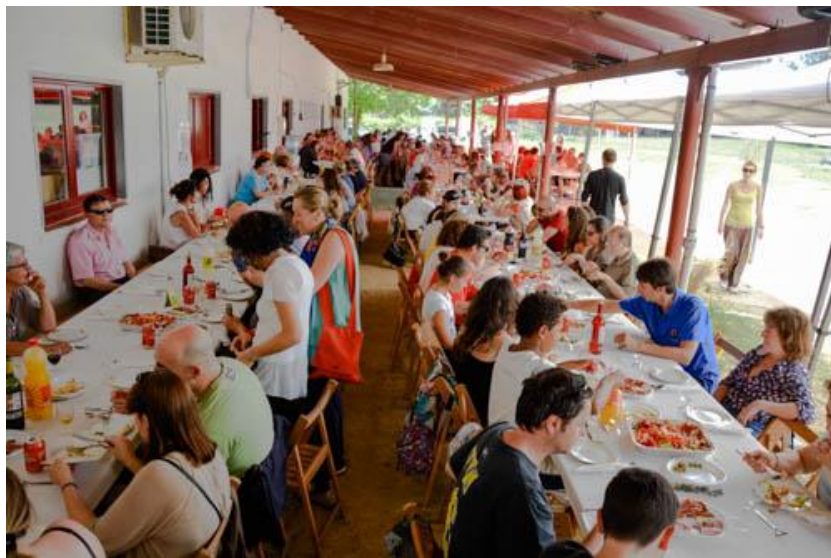
Arroz Solidario 2015

El día 10 de mayo de 2015 se celebró en la Escuela Bressol Gespa de la UAB el XIV Arroz Solidario . El acto, organizado por el AdiaGrupCerdanyola, fue un éxito que reunió a unas 175 personas. Los fondos recaudados se destinaron a los proyectos de ADIA.