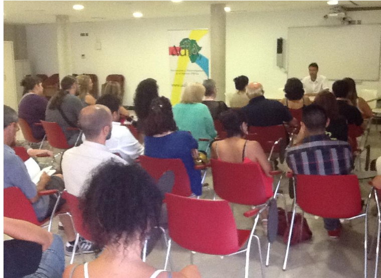
Presentación del libro El color del hilo en la sede del CEM La Mar Bella

La colección Edicions Solidàries tiene como objetivo publicar trabajos de carácter solidario, humano y con un claro contenido en valores y sus autores ceden todos los derechos de forma altruista. Edicions Solidàries colabora en la difusión de la acción solidaria, busca consolidar su actividad con el patrimonio cultural y se propone obtener recursos económicos de apoyo a la labor desarrollada por ADIA.