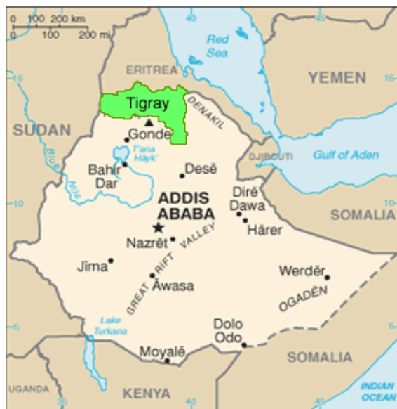
Mapa de Etiopía con la región del Tigray

Adia trabaja desde el año 1998 con el objetivo de reducir la desnutrición que sufre la población menor de 5 años y la mortalidad asociada a ésta en la región del Tigray, Etiopía. Para alcanzar este objetivo desarrollamos diversos proyectos orientados a incidir sobre las causas de la inseguridad alimentaria en la zona y paliar sus efectos.