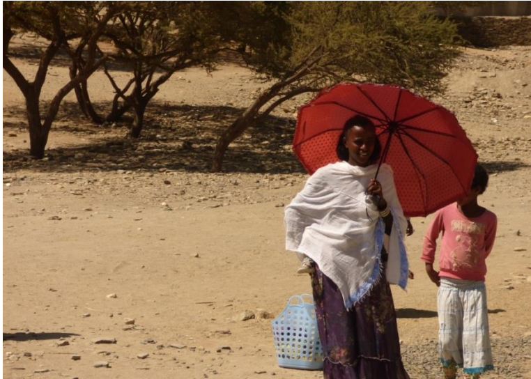
Imatge del Tigray

directa de diversos factors: de l'escàs i variable règim de pluges (menys de 450 mm/any distribuïts irregularment), de la pèrdua de fertilitat del sòl i de la reduïda mida de les parcel·les inferior a l'hectàrea per família. Com a resultat es genera durant una gran part de l'any, agreujat darrerament pel canvi climàtic, un dèficit d'aliments crònic que provoca una forta dependència de l'ajut alimentari internacional, de les remeses que arriben des de l'estranger i de les oportunitats de treball puntual a la ciutat. Segons un estudi de l'Oficina de Finances del Tigray, a la woreda d'Irob la població ha d'afrontar escassetat d'aliments durant gairebé 7 mesos l'any.