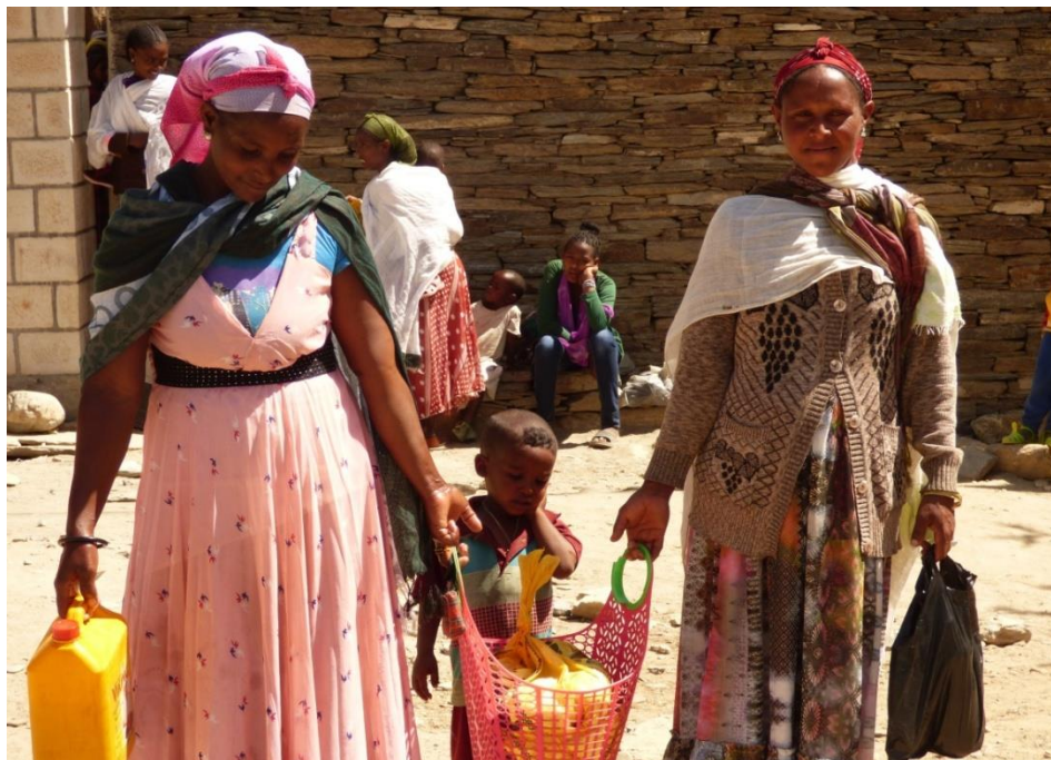
Programa suplement nutricional: distribució de la ració seca

Durant l'any 2016, l'aplicació del programa va proporcionar suplement nutritiu i atenció mèdica a 1.700 nens i nenes amb desnutrició moderada de les woredas d'Irob i Kelte-Awlaelo; el programa es complementa amb la capacitat en salut, higiene i planificació familiar que s'adreça a les mares amb la finalitat de millorar les condicions de vida i de salut de la llar i, per extensió, de la comunitat.