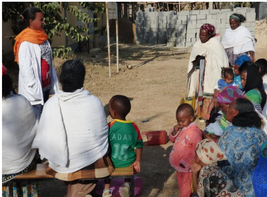
Programa suplement nutricional: formació de les mares

Aprofitant també el moment de la distribució, les mares dels infants reben les sessions d'Educació per a la salut. El Programa de nutrició suplementària considera aquestes sessions una activitat clau que està en línia amb l'estratègia preventiva de la política de salut del govern etiòp. El Programa va oferir a les mares dels menors diverses sessions d'educació en salut, higiene i nutrició dinamitzades per l'educador/a del centre de salut amb la col·laboració del personal d'infermeria. Les formacions es fan en grups d'unes 25 mares durant 15-20 minuts.