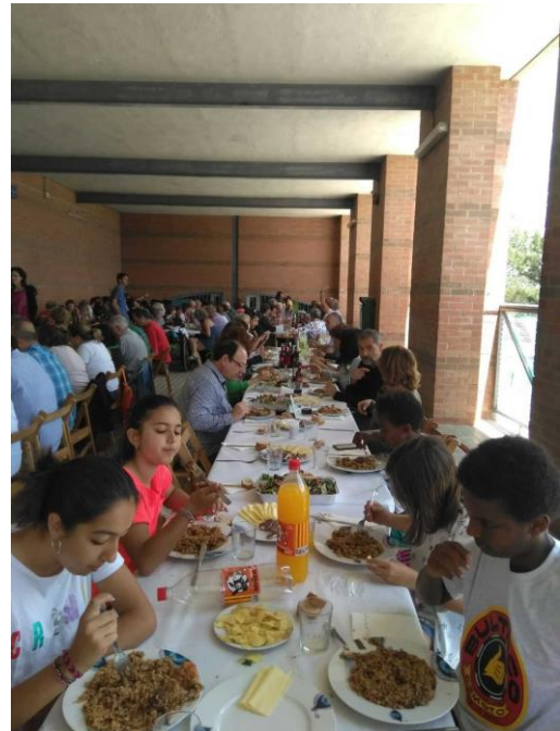
Arròs solidari 2016

El dia 5 de juny de 2016 es va celebrar a l' Institut Pere Calders de la UAB el XVè Arròs Solidari . L'acte, organitzat per l'AdiaGrupCerdanyola, va ser un èxit que va aplegar unes 170 persones. Els fons recaptats es van destinar als projectes d'ADIA.