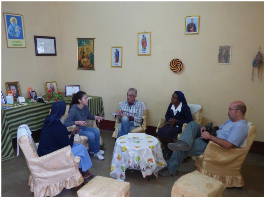
Programa suplement nutricional: reunió de seguiment a Alitena

La distribució del suplement alimentari es fa setmanalment al centre de salut on es prepara l'anomenada ració seca de cada infant (cada dues setmanes en el cas d'Agulae i Negash). La base del suplement alimentari, anomenada comercialment Famix 4 , s'adquireix al propi país, complint amb la premissa de potenciar les capacitats locals i contribuir al seu desenvolupament.