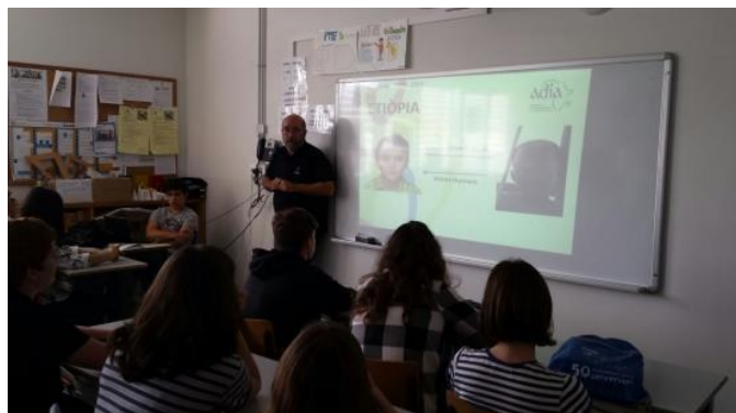
Jornada Centre d'Estudis Voramar

Els dies 21, 22, 23 i 24 de març de 2016 el Consell de l'Esport Escolar de Barcelona i ADIA van celebrar a les instal·lacions del CEM la Mar Bella , la 3a edició del Campus Esportiu Solidari . Aquesta activitat s'adreça a nens i nenes d'edats entre 7 i 14 anys que van poder gaudir durant tot el dia (de 9h a 18h) de la seva modalitat esportiva preferida, el bàsquet. En aquesta ocasió van participar-hi un total de 70 nens i nenes. Un cop cobertes les despeses d'organització, el guany net recaptat de les inscripcions es va destinar als projectes d'ADIA.