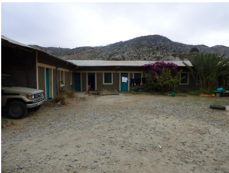
Seu de Daughters of Charity a Alitena

La congregació de monges du a terme diferents programes socials de desenvolupament per afrontar les necessitats de les comunitats locals de la regió del Tigray, i són les encarregades de l'execució i seguiment del Programa de nutrició suplementària que es va començar a implementar a Alitena l'any 2008.