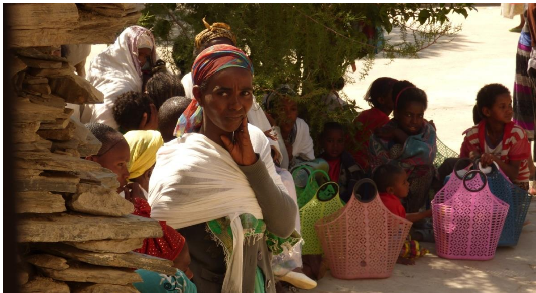
Programa suplement nutricional: esperant la distribució del suplement.

El tractament, que inclou la barreja del Famix (6kg) amb oli (1l) i sucre (½kg), té una durada d'un trimestre i les nenes i nens formen part del Programa fins que assoleixen els valors mínims de pes/edat establerts.