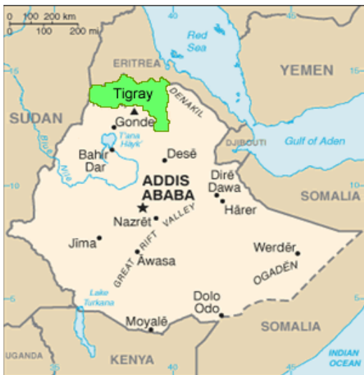
Mapa d'Etiòpia amb la regió del Tigray

ADIA treballa des de l'any 1998 amb l'objectiu de reduir la desnutrició que pateix la població menor de 5 anys i la mortalitat associada a aquesta en la regió del Tigray, Etiòpia. Per aconseguir aquest objectiu desenvolupem diversos projectes orientats a incidir sobre les causes de la inseguretat alimentària en la zona i pal·liar els seus efectes.