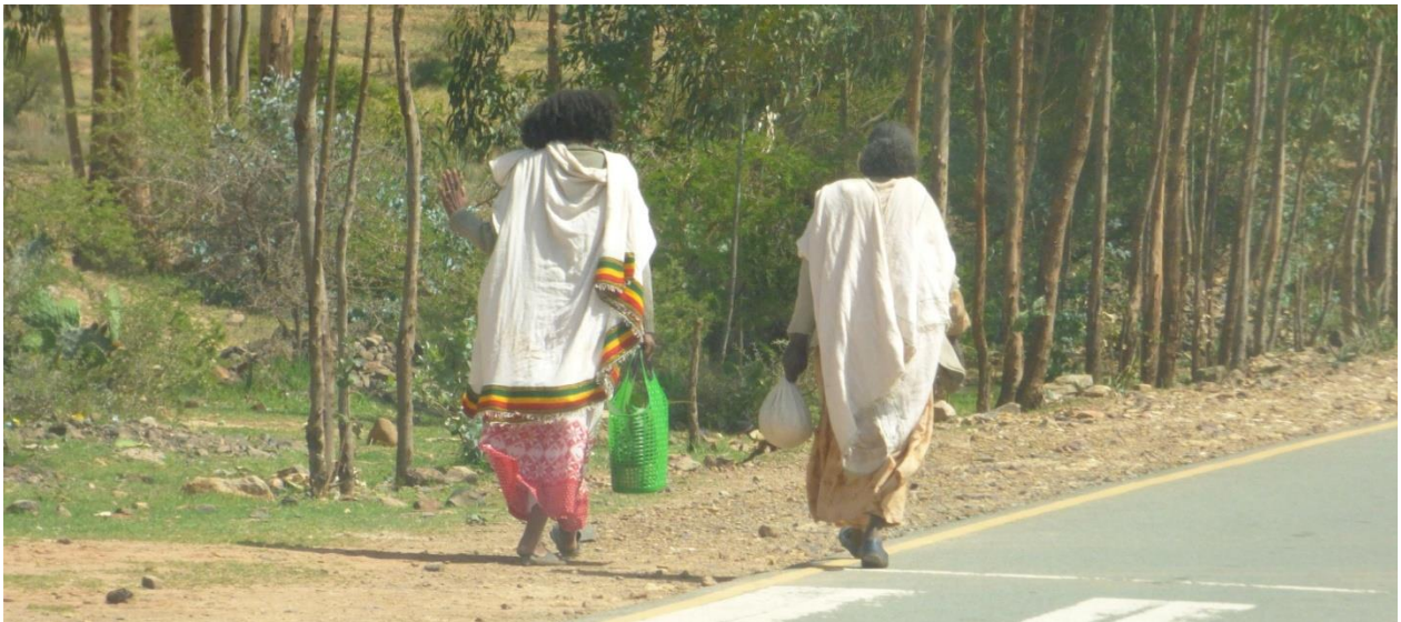
Imatge del Tigray

directa de diversos factors: de l'escàs i variable règim de pluges (menys de 450 mm/any distribuïts irregularment), de la pèrdua de fertilitat del sòl i de la reduïda mida de les parcel·les, inferior a l'hectàrea per família. Com a resultat es genera durant una gran part de l'any, agreujat darrerament pel canvi climàtic, un dèficit d'aliments crònic que provoca una forta dependència de l'ajut alimentari internacional, de les remeses que arriben des de l'estranger i de les oportunitats de treball puntual a la ciutat. Segons un estudi de l'Oficina de Finances del Tigray, a la woreda d'Irob la població ha d'afrontar escassetat d'aliments durant gairebé 7 mesos l'any.