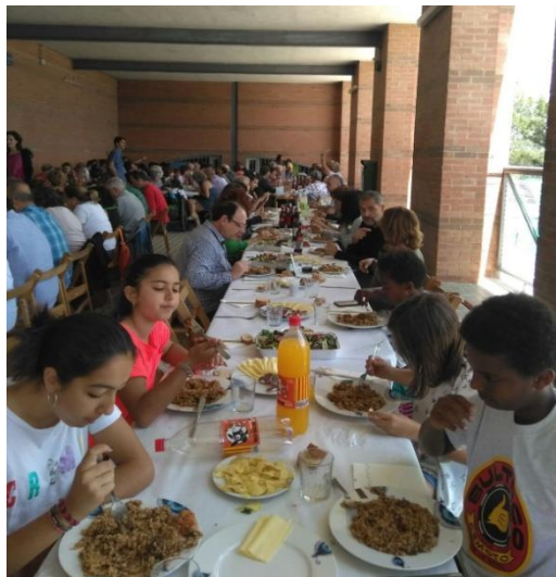
Arròs solidari 2017

El diumenge 21 de maig de 2017 va tenir lloc a l' Institut Pere Calders del Campus de la Universitat Autònoma de Barcelona - UAB el XVI Arròs Solidari . L'acte, organitzat per l'AdiaGrupCerdanyola, va ser un èxit que va aplegar unes 150 persones. Els fons recaptats es van destinar als projectes de l'Associació.