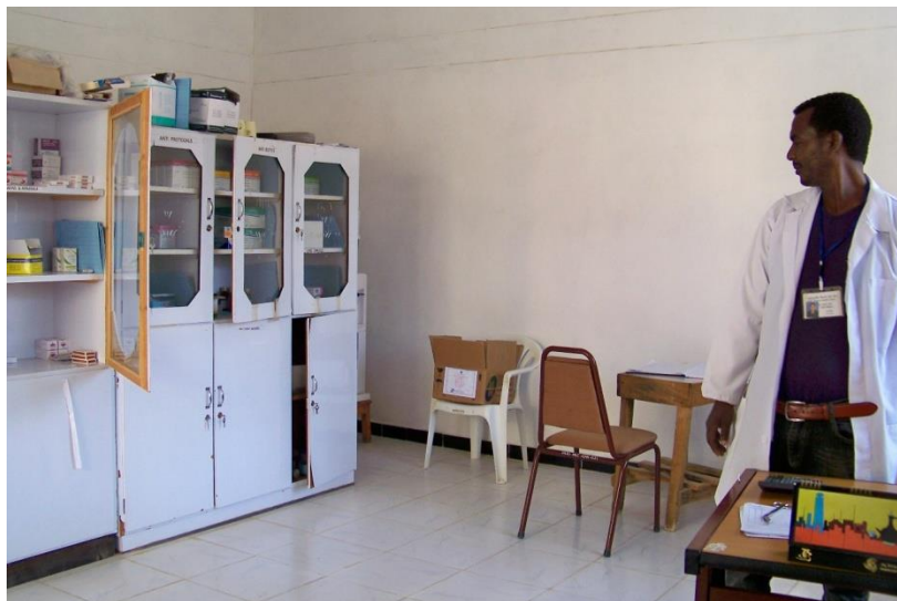
Centre de Salut d'Alitena

La congregació de monges du a terme diferents programes socials de desenvolupament per afrontar les necessitats de les comunitats locals de la regió del Tigray, i són les encarregades de l'execució i seguiment del Programa de nutrició suplementària que es va començar a implementar a Alitena l'any 2008.