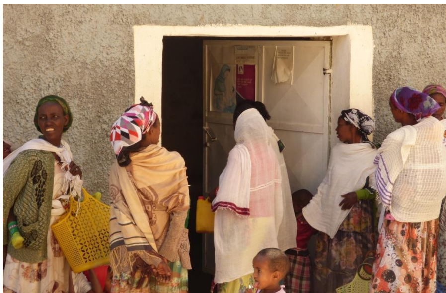
Programa de suplement nutricional: esperant la distribució del suplement.

El tractament, que inclou la barreja del Famix (6kg) amb oli (1l) i sucre (½kg), té una durada d'un trimestre i les nenes i nens formen part del Programa fins que assolixen els valors mínims de pes/edat establerts.