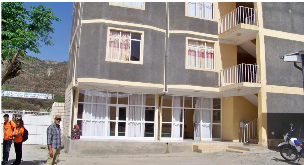
Centre de Salut d'Alitena

La congregació de monges du a terme diferents programes socials de desenvolupament per afrontar les necessitats de les comunitats locals de la regió del Tigray, i són les encarregades de l'execució i seguiment del Programa de nutrició suplementària que es va començar a implementar a Alitena l'any 2008. Durant l'any 2018 han començat a treballar en un projecte d'esport com a eina d'inclusió social.