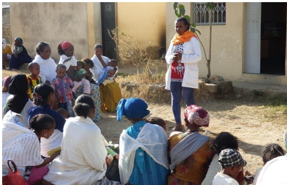
Programa de suplement nutricional: educació en salut.

S'ha pogut comprovar que les mares que han rebut la capacitatció apliquen els coneixements adquirits a la seva vida diària, amb la qual cosa es millora la qualitat de vida de la unitat familiar i actuen com a agents transmissors de la formació rebuda cap a la resta de la comunitat.