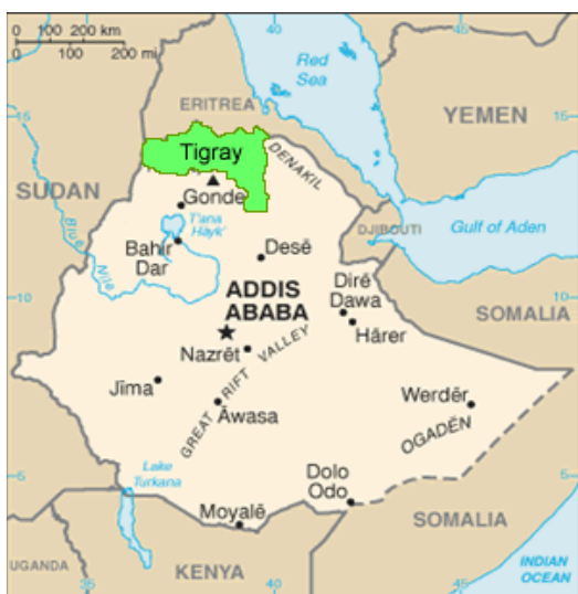
Mapa d'Etiòpia amb la regió del Tigray

ADIA treballa des de l'any 1998 amb l'objectiu de reduir la desnutrició que pateix la població menor de 5 anys i la mortalitat associada a aquesta en la regió del Tigray, Etiòpia. Per aconseguir aquest objectiu desenvolupem diversos projectes orientats a incidir sobre les causes de la inseguretad alimentària en la zona i pal·liar els seus efectes.