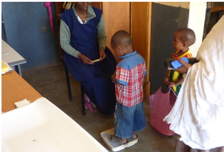
Programa de suplement nutricional: control de pes i alçada

L'execució del programa durant l'any 2018 va proporcionar suplement nutritiu i atenció mèdica a 1.000 nens i nenes amb desnutrició moderada de la woreda d'Irob; el programa es complementa amb la capacitat en salut, higiene i planificació familiar que s'adreça a les mares amb la finalitat de millorar les condicions de vida i de salut de la llar i, per extensió, de la comunitat.