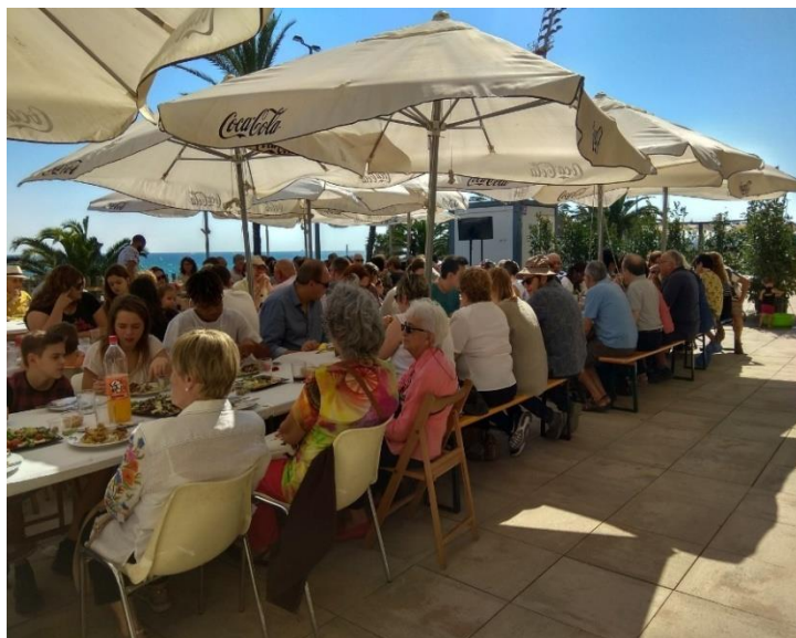
Foto: Dinar solidari 2018

El diumenge dia 16 de desembre de 2018 , a l' Ateneu de Cerdanyola , va tenir lloc un Concert Solidari de la mà de Veus Sense Fronteres i amb la col·laboració de l' Escola Xarau ; tota la recaptació de la venda d'entrades va anar destinada als projectes d'ADIA.