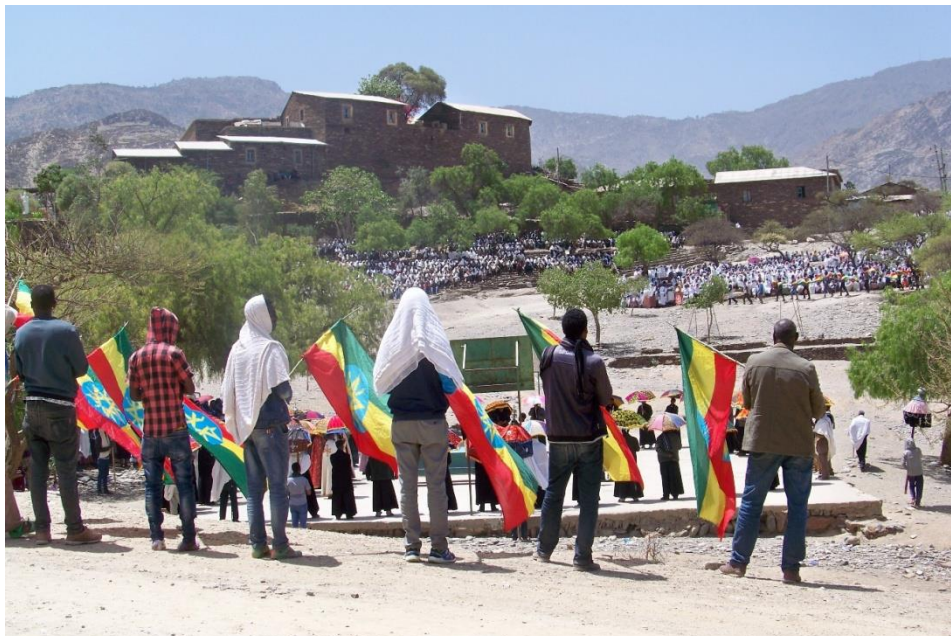
Imatge del Tigray

La majoria de la població del Tigray depèn íntegrament de la producció agrícola i ramadera. Els principals cultius de la zona són el tef 3 , mill, blat, ordi, pèsols, faves, llenties i llavors de lli, però malauradament la seva productivitat no excedeix els 300-400 kg per hectàrea. Aquesta baixa productivitat és conseqüència directa de diversos factors: de l'escàs i variable règim de pluges (menys de 450 mm/any distribuïts irregularment), de la pèrdua de fertilitat del sòl i de la reduïda mida de les parcel·les, inferior a l'hectàrea per família. Com a resultat es genera durant una gran part de l'any, agreujat darrerament pel canvi climàtic, un dèficit d'aliments crònic que provoca una forta dependència de l'ajut alimentari internacional, de les remeses que arriben des de l'estranger i de les oportunitats de treball puntual a la ciutat. Segons un estudi de l'Oficina de Finances del Tigray, a la woreda d'Irob la població ha d'afrontar escassetat d'aliments durant gairebé 7 mesos l'any.