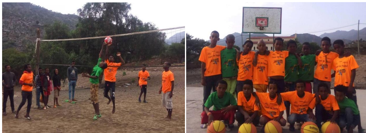
Programa Nutrició i Esport: Joves d'Alitena participants en el programa

Després de la primera experiència a la ciutat de Wukro, amb 100 nens i nenes, durant l'any 2018 es va emprendre una experiència similar a Alitena amb la contrapart Daughters of Charity, la qual ja havia exposat en anys anteriors les dificultats que tenien entre els grups de joves en risc d'exclusió que intenten reorientar a través del Centre Social Local. El programa a Alitena i poblacions veïnes es focalitza en utilitzar l'esport com a eina per al desenvolupament positiu dels infants i adolescents, tant a nivell personal com social. En aquest primer any van participar 58 joves entre 8 i 16 anys dividits en 5 grups: 2 grups de voleibol (25 participants) i 3 grups de bàsquet (33 participants), que entrenaven dues vegades per setmana en sessions d'hora i mitja.