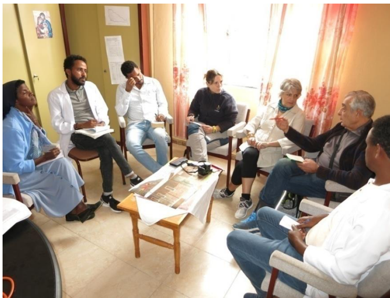
Reunión entre ADIA i el equipo de Daughters of Charity en Alitena

La congregación de monjas lleva a cabo diferentes programas sociales de desarrollo para hacer frente a las necesidades de las comunidades locales de la región del Tigray y son las encargadas de la ejecución y seguimiento del Programa de nutrición suplementaria que se empezó a implementar en Alitena el año 2008. En el año 2018 empezaron a trabajar en un proyecto de deporte como herramienta de inclusión social.