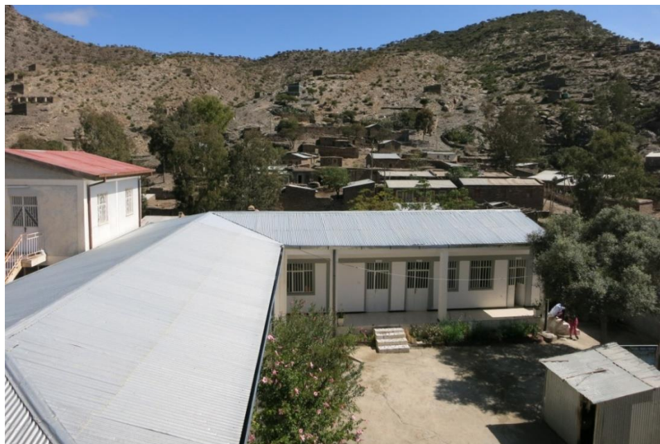
Centro de Salud de Alitena

La ejecución del programa durante el año 2019 proporcionó suplemento nutritivo y atención médica a 1.600 niñas y niños con desnutrición moderada de la woreda de Irob; el programa se complementa con la capacitación en salud, higiene y planificación familiar que se dirige a las madres con el fin de mejorar las condiciones de vida y de salud del hogar y, por extensión, de la comunidad.