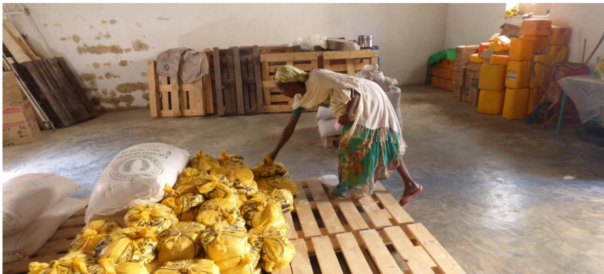
Programa suplemento nutricional: distribución de la llamada reción seca.