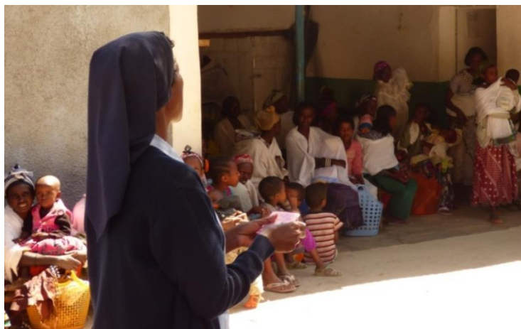
Programa de suplemento nutricional: educación en salud.

Se ha podido comprobar que las madres que han recibido la capacitación aplican los conocimientos adquiridos en su vida diaria, mejoran la calidad de vida de la unidad familiar y actúan como agentes de transformación social al transmitir la formación recibida hacia el resto de la comunidad.