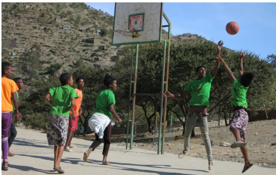
Programa Nutrición y Deporte: entrenamiento de baloncesto en equipos mixtos.

Cada domingo, se organiza un “festival” deportivo que les permite prepararse para las competiciones promovidas por la administración local y facilita los partidos amistosos contra otros equipos de la región. Esta actividad es también un dinamizador de la vida social de las comunidades puesto que atrae a los seguidores que se ven representados por sus equipos.