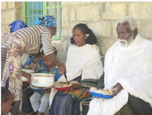
Proyecto de apoyo a la "Gente Mayor"

preparan y sirven las comidas en el comedor, 1 persona lleva la comida a personas mayores con movilidad reducida y las ayuda en sus necesidades básicas, 1 guarda que también realiza tareas de limpieza y mantenimiento y 3 personas que las 24 h, en turnos de 12 h, dan apoyo domiciliario a personas sin movilidad (les van a comprar, les hacen la limpieza, les hacen las curas, las animan a salir a la calle en la medida de sus posibilidades y les hacen compañía).