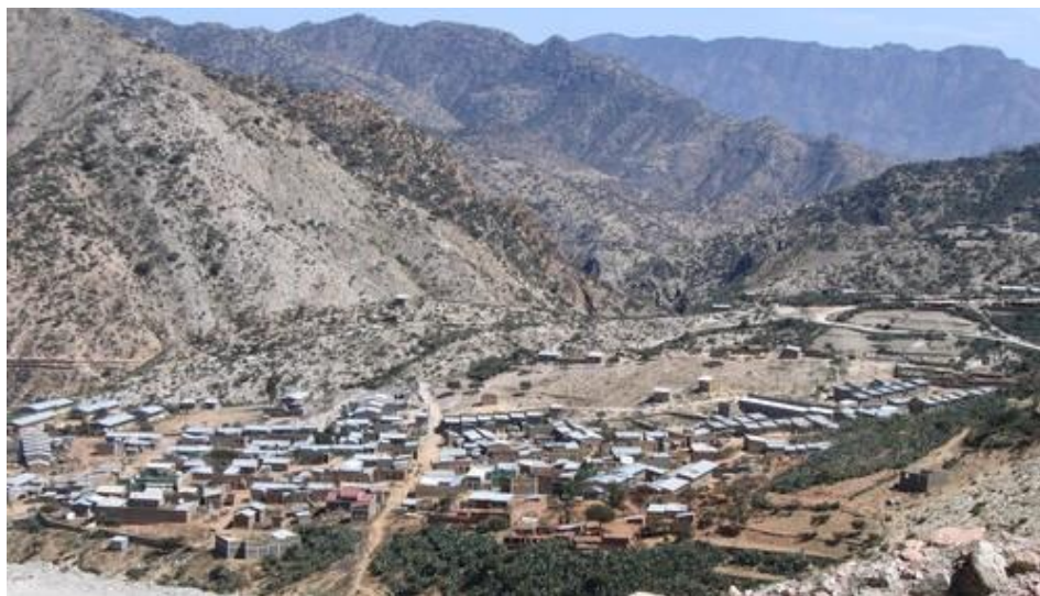
Imagen de Dowhan, Centro administrativo de la woreda de Irob

pero desgraciadamente su productividad no excede los 300-400 kg por hectárea. Esta baja productividad es consecuencia directa de varios factores: del escaso y variable régimen de lluvias (menos de 450 mm/año distribuidos irregularmente), de la pérdida de fertilidad del suelo y del reducido tamaño de las parcelas, inferior a la hectárea por familia. Como resultado se genera durante una gran parte del año, agravado últimamente por el cambio climático, un déficit de alimentos crónico que provoca una fuerte dependencia de la ayuda alimentaria internacional, de las remesas que llegan del extranjero y de las oportunidades de trabajo puntual en la ciudad. Según un estudio de la Oficina de Finanzas del Tigray, en la woreda de Irob la población afronta escasez de alimentos durante casi 7 meses al año.