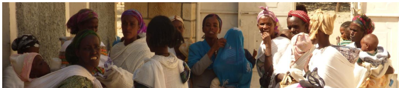
Programa de suplemento nutricional: madres y criaturas el día de distribución del suplemento

Durante el año 2019, 1.600 niñas y niños con malnutrición moderada han recibido el suplemento nutritivo , y de estos el 98,4% ha alcanzado una relación peso/talla y un MUAC óptimos para la edad. En todo el año no fue necesario readmitir ninguno al programa.