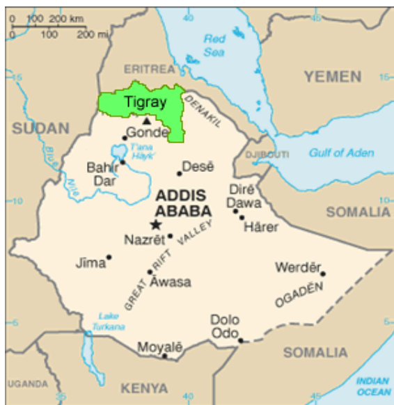
Mapa de Etiopía con la región del Tigray

ADIA trabaja desde el año 1998 con el objetivo de reducir la desnutrición que sufre la población menor de 5 años y la mortalidad asociada a esta en la región del Tigray, Etiopía. Para alcanzar este objetivo desarrollamos varios proyectos orientados a incidir sobre las causas de la inseguridad alimentaria en la zona y paliar sus efectos.