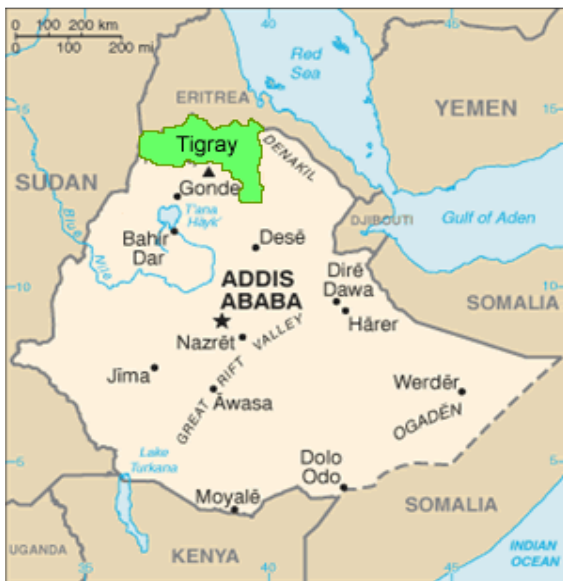
Mapa de Etiopía con la región del Tigray

ADIA trabaja desde el año 1998 con el objetivo de reducir la desnutrición que sufre la población menor de 5 años y la mortalidad asociada a esta en la región del Tigray, Etiopía. Para alcanzar este objetivo desarrollamos varios proyectos orientados a incidir sobre las causas de la inseguridad alimentaria en la zona y paliar sus efectos.