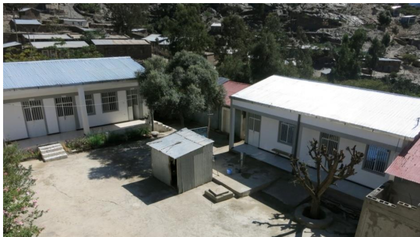
Centro de Salud de Alitena

La ejecución del programa durante el año 2020 pretendía proporcionar suplemento nutritivo y atención médica a 1.600 niños y niñas con desnutrición moderada de la woreda de Irob; el programa se complementaba con la capacitación en salud, higiene y planificación familiar dirigida a las madres con el fin de mejorar las condiciones de vida y de salud del hogar y, por extensión, de la comunidad.