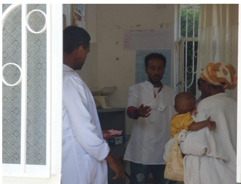
Programa de suplemento nutricional: personal del Programa en Alitena.

Se ha podido comprobar que las madres que han recibido la capacitación aplican los conocimientos adquiridos en su vida diaria, mejoran la calidad de vida de la unidad familiar y actúan como agentes de transformación social al transmitir la formación recibida hacia el resto de la comunidad.