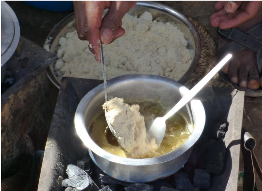
Programa de suplement nutricional: barreja del Famix amb l'oli i el sucre.