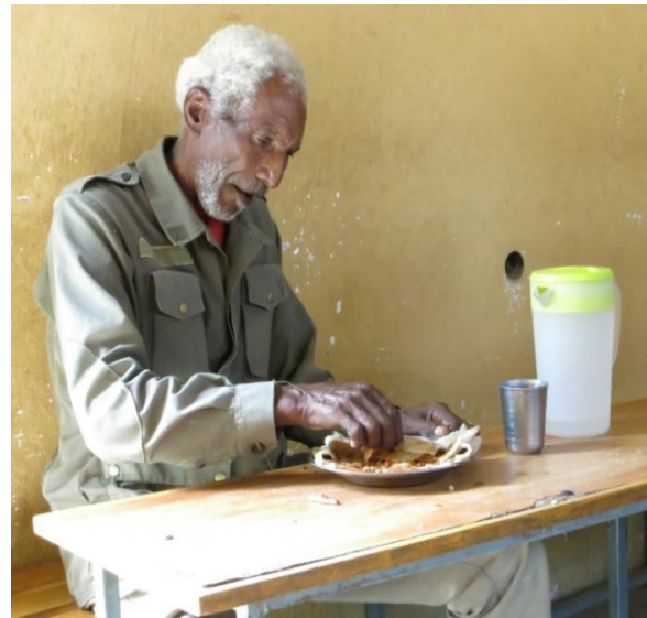
Projecte de suport a la "Gent Gran"

En el menjador es dona servei a 50 persones; per dur a terme aquest propòsit es disposa d'un recinte adjacent al centre. Els beneficiaris reben l'esmorzar, el dinar i el sopar cada dia. Per donar servei a les 50 persones beneficiàries del centre un grup de 7 treballadors s'encarreguen de dur a terme les diferents tasques: 2 persones que preparen i serveixen els àpats en el menjador, 1 persona porta el menjar a la gent gran que té la mobilitat reduïda i les ajuda en les necessitats bàsiques, 1 guarda que també fa tasques de manteniment i 3 persones que les 24h, en torns de 12h, donen suport domiciliari a persones sense mobilitat.