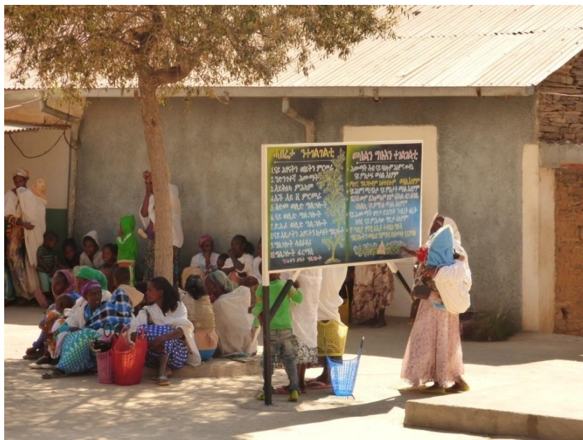
Programa de suplement nutricional: dia de distribució del suplement.

Durant l'any 2020, 1.200 infants amb malnutrició moderada han rebut el suplement nutritiu . Dels 400 infants que es van poder monitoritzar durant el primer trimestre, el 100% va assolir una relació pes/talla o un MUAC òptims per l'edat. En tot l'any no va ser necessari readmetre cap infant al programa.