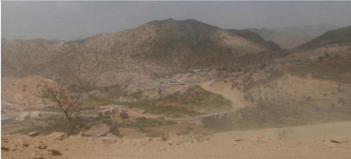
Imatge d'Alitena des de la polsosa pista d'accés.

de 450 mm/any distribuïts irregularment), de la pèrdua de fertilitat del sòl i de la reduïda mida de les parcel·les, inferior a l'hectàrea per família. Com a resultat es genera durant una gran part de l'any, agreujat darrerament pel canvi climàtic, un dèficit d'aliments crònic que provoca una forta dependència de l'ajut alimentari internacional, de les remeses que arriben des de l'estranger i de les oportunitats de treball puntual a la ciutat. Segons un estudi de l'Oficina de Finances del Tigray, a la woreda d'Irob la població ha d'afrontar escassetat d'aliments durant gairebé 7 mesos l'any.